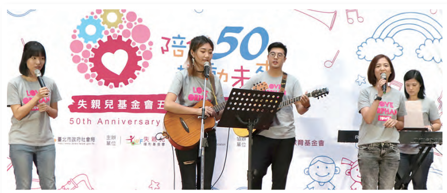
▲失親兒少代表革力卜和老師們共同演唱《我找愛》，現場氣氛活潑熱烈。

時間：2018年12月2日(日) PM 14:30-17:30 地點：中油大樓國光廳 (台北市信義區松仁路3號)