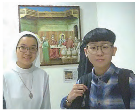
▲生命教育中心承辦生命分享音樂會，教導學生欣賞、尊重不同生命經歷