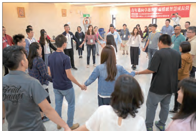
▲在真福山舉辦的2018情感智慧成長營，未婚男女打開心扉共融學習。 ▲2018青年邁向卓越與幸福情感智慧成長營，會後歡喜大會照。