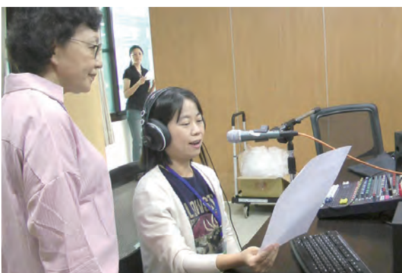
▲第1次透過廣播聽到自己的聲音，都會有「吃驚」的喜悅。 ▶嘉義教區27位教友參加了真理電台的影音課程實戰研習。