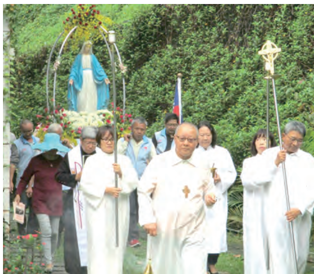
▲浩浩蕩蕩的聖母遊行，在聖母山莊做了最好的在地福傳。