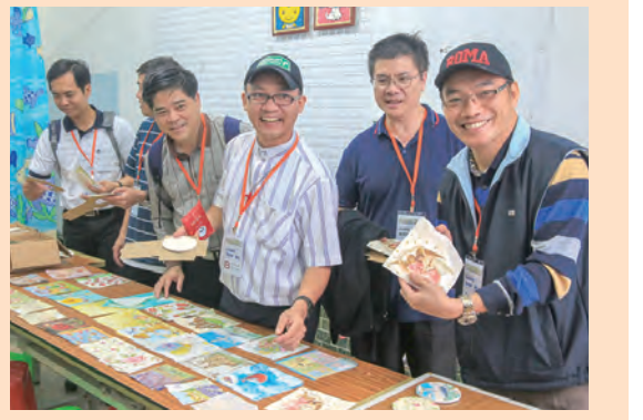
▲神父們在石碇天主堂所設的藝術工作坊學習創作各種手作藝術，成果輝煌，神情愉悅；並在聖堂前的琉璃藝術堂名下合影留念，感謝這一趟快樂的共融。

感謝天主讓這個山城中的偏鄉小堂區，藉著琉璃畫展開這座87年老教堂的大門，推動福傳活動，使這個小教堂充滿無限的朝氣和希望，歡迎全省各堂區的兄弟姊妹們，日後可以將石碇耶穌聖心天主堂規畫進各堂區的朝聖路線之一。我們也為聖召祈禱，為神父們的身體健康及「永為司鐸」的神聖使命祈禱。