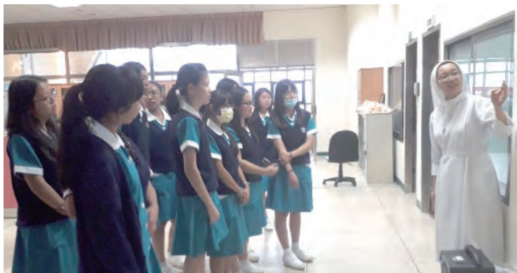
▲生命教育中心簡短介紹展覽在校內的聖像畫「耶穌的奇蹟」