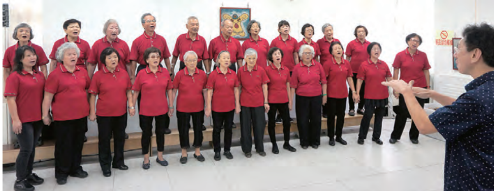
▲石碇區老年大學歌唱班率先表演合唱，這群「活到老、學到老」的長輩們展現出不凡歌藝。 ▼新店區長春里樂活歌唱班的長輩們活力十足，感性十分，一襲小碎花衣裳更顯得青春無敵。

首先是石碇區老年大學歌唱班帶來的〈風鈴聲〉與〈思念的海〉；接著是木柵復活堂長青文康小站以國、台