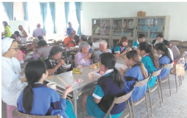
▲與湖北的長輩們一起共進午餐，學習愛德、陪伴與服務的精神