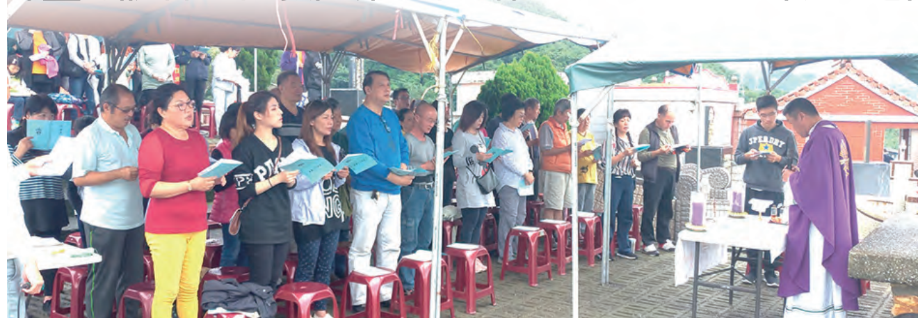
▲聖山墓園追思亡者彌撒