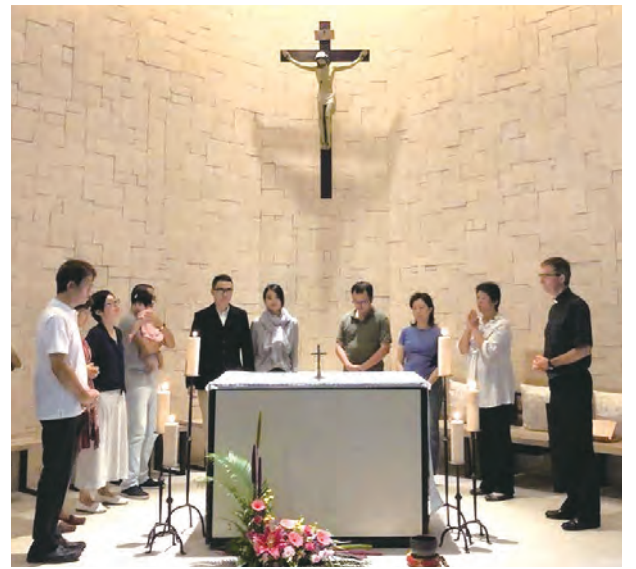
▲加納夫妻靈修營的淺嚐會，讓夫婦們在主台前一起經驗主耶穌建立婚姻聖事的美好與重要。

我們夫婦是在1996年參加普世夫婦懇談會周末營，營後立即進入志工夫婦團體。過去20多年來我們一直在團體中成長。為了準備周末營的分享稿，理工科出身的我，就像充滿理想的戰士，在戰場上衝鋒直撞，搞得遍體鱗傷，左邊是中了「感受」的槍，右邊又是「傾聽」的砲，但是無論如何，正如《羅馬人書》第8章28節所言：「天主使一切都來協助那些愛祂的人。」在過程中我們感受到「施比受更有福」。在團