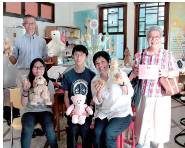
午5時，地點在文藻外大安琪廣場前。安琪小站設立後陸續舉辦了藝術志工襪子娃娃及聖誕賀卡的設計，也與文藻外大諮商輔導中心合作，不定期提供藝術成長團體在小站內進行創作。

安琪小站開放時間為周一至周五，每日上午8時至下午5時，地點在文藻外大安琪廣場前。安琪小站設立後陸續舉辦了藝術志工襪子娃娃及聖誕賀卡的設計，也與文藻外大諮商輔導中心合作，不定期提供藝術成長團體在小站內進行創作。