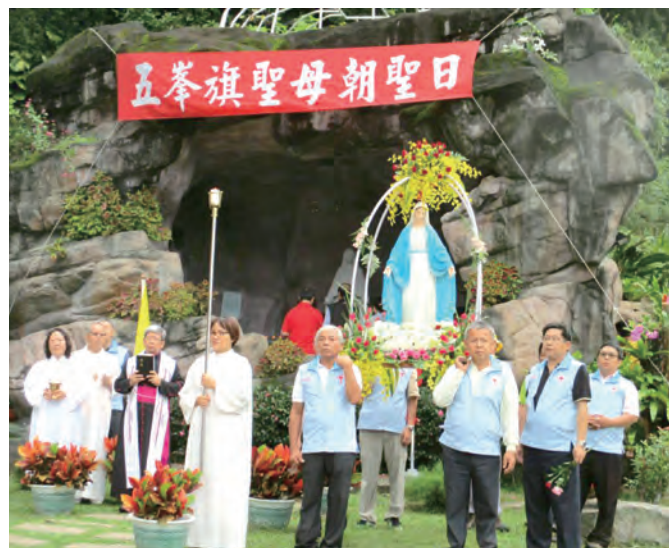
▲遊行隊伍至聖母洞前，同心合意祈禱。 ▼參禮教友勸領聖體