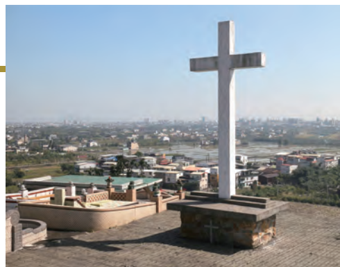
▲懷親樓面對祭台遙望優美蘭陽平原及龜山島