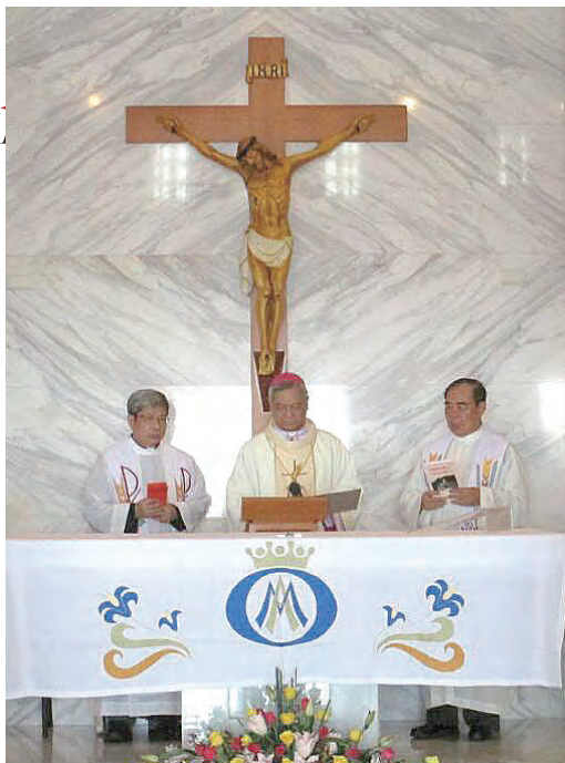
▲洪山川總主教禮堂慶感恩聖祭